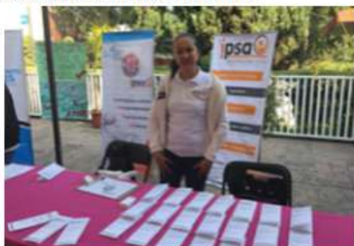
Participación en la Feria de Servicios en el marco del Mes del Trato Igualitario 2016, invitados por INMUJERES CD-CDMX

Y es partir de este momento, que la Asociación Civil comenzó con su proceso de profesionalización de actividades.