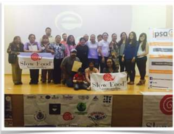
Taller de capacitación "Transformando Líderes e identificación de habilidades emprendedoras" para grupo productivo PROMANA, Nanacamilpa Tlaxcala.

Ser la organización sustentable de reconocido prestigio y credibilidad nacional e internacional, derivado de su creciente contribución al empoderamiento económico y mejoramiento de la calidad de vida de su población objetivo