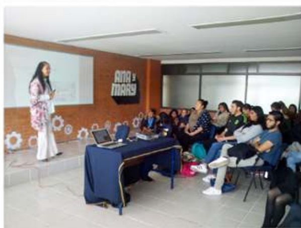
Impartiendo Taller "Modela tu Idea de Negocio" a estudiantes del Instituto Universitario del Estado de México

Nuestra propuesta de atención nos ha llevado a participar como voceras de la campaña #Pepe y Toño y #Ana y Mary del Consejo de la Comunicación, impartiendo pláticas, talleres y conferencias a jóvenes estudiantes de nivel bachillerato y licenciatura de la Ciudad y Estado de México.